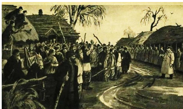
Восстание крестьян в селе Бездне.